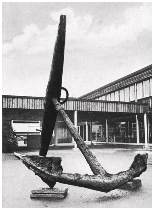
■ Один из якорей «Вазы», который вчерне был изготовлен в регионе Бергслаген, а потом прошел окончательную обработку в кузнице на Скеппхольмене

ходом работ на «Вазе». Однако основательно проинспектировать за один день верфь таких размеров едва ли было возможно. Кроме административного здания, где проживала семья Хюбертссон, имелись вместительные склады для древесины, судового снаряжения и инструментов, а также кузница, в которой в основном работали валлоны.