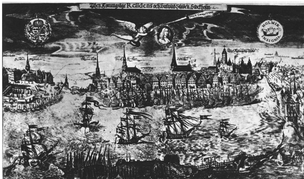
■ Стокгольм в середине XVII века. Вид от острова Шеппсхольмен (в переводе «Корабельный остров») на старый город с королевским замком «Три короны». Медная гравюра Вольфганга Хартмана с левой стороны ограничена кирхой Марии Магдалены на Сёдермальм, а с правой стороны частью верфи Блазиенхольмен на Норрмальм